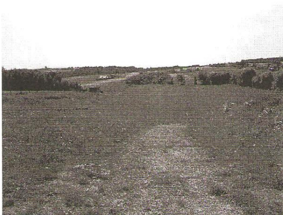
Droga do płyty stadionu do remontu